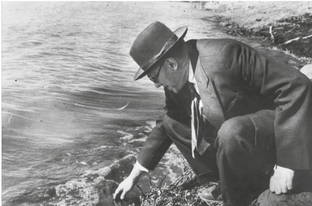
Михаил Алексеевич Лаврентьев у Обского моря