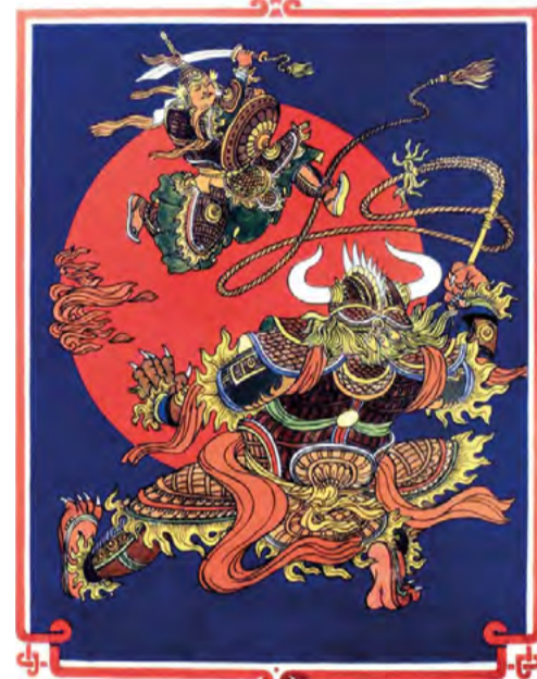
Сцены из эпоса «Абай Гэсэр» в иллюстрациях Чингиза Шонхорова

Конференция «Эпос «Гэсэр» — духовное наследие народов Центральной Азии» приурочена к 25-й годовщине празднования тысячелетия этого героического произведения.