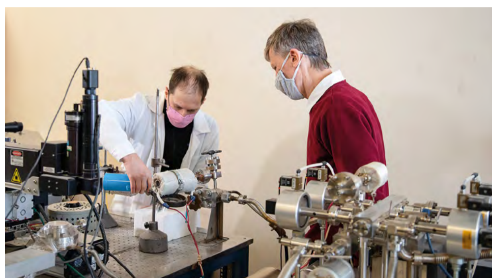
В лаборатории изотопно-аналитической геохимии ИГМ СО РАН

Известный калий-аргоновый метод основан на спонтанном распаде в аргон одного из изотопов калия. Если взять геологический минерал, измерить в нем содержание калия и аргона, то можно рассчитать, сколько миллионов лет он пролежал в земле. Однако, когда ученые начали работать с дефицитными материалами (например, привезенными с Луны), возникла необходимость использо-