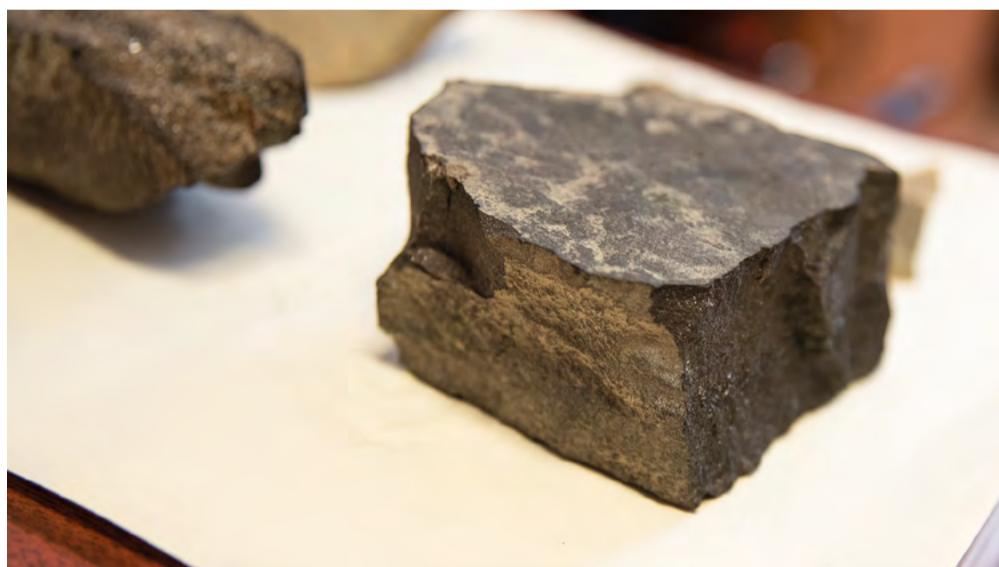
Порода, содержащая органическое вещество

предположить, какое количество углеводородов могло образоваться в породе. «Газогенерационный потенциал породы — это способность производить нефть или газ. Мы оцениваем количество углеводорода, которое уже сгенерировала порода и еще потенциально сможет создать. По маленькому образцу можно